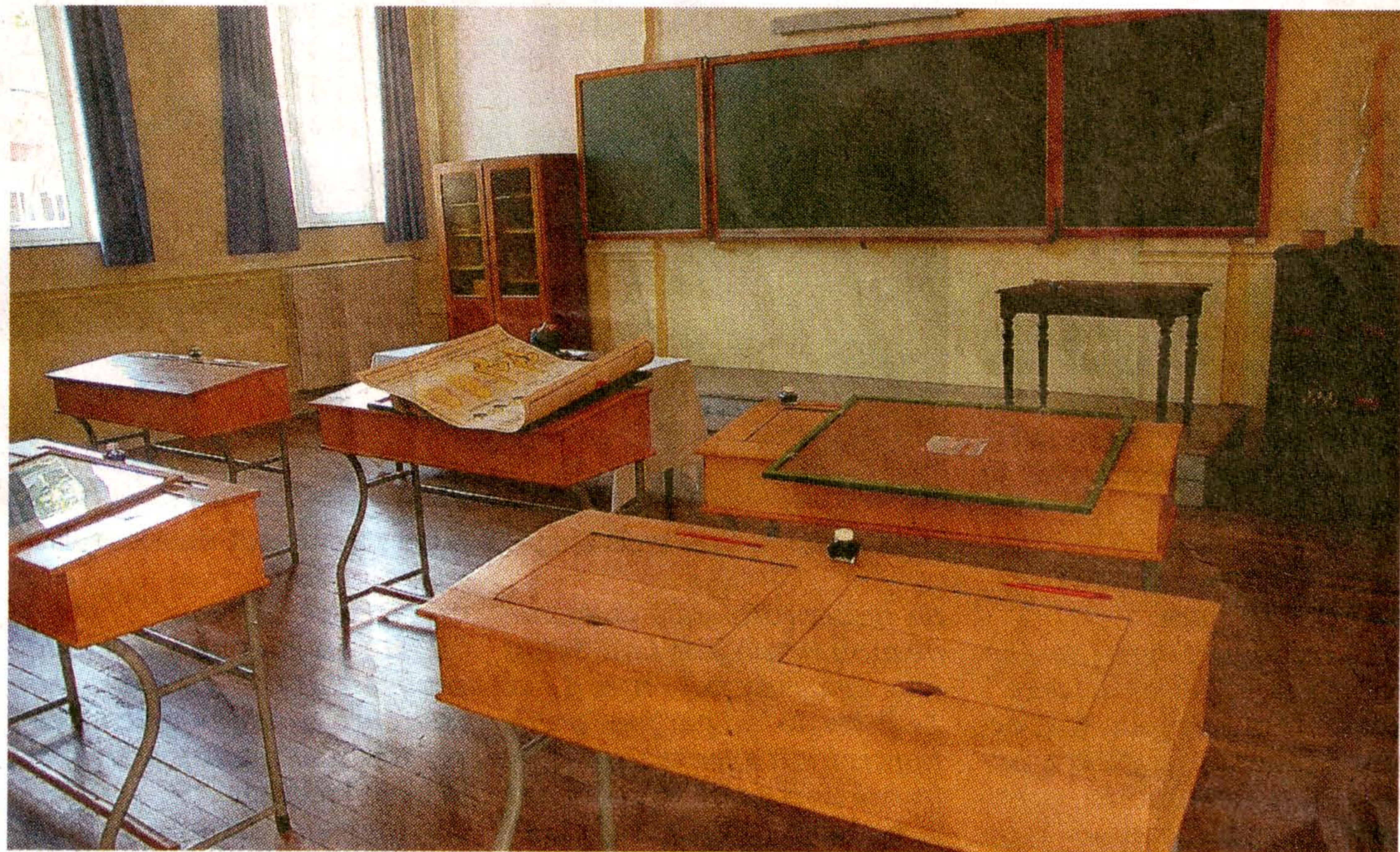
Une classe d'époque a été reconstituée à l'Athénée pour accueillir les participants du jeu. ■ GDS

En bref, une vingtaine d'adolescents vont remonter le temps et retourner dans les années 50. L'Athénée Thill Lorrain sera dès lors transformé en pensionnat de l'époque et équipé en conséquence. Aucun détail ne devrait être négligé. La photo ci-contre le prouve à souhait et donne un avant-goût de ce qui attend les