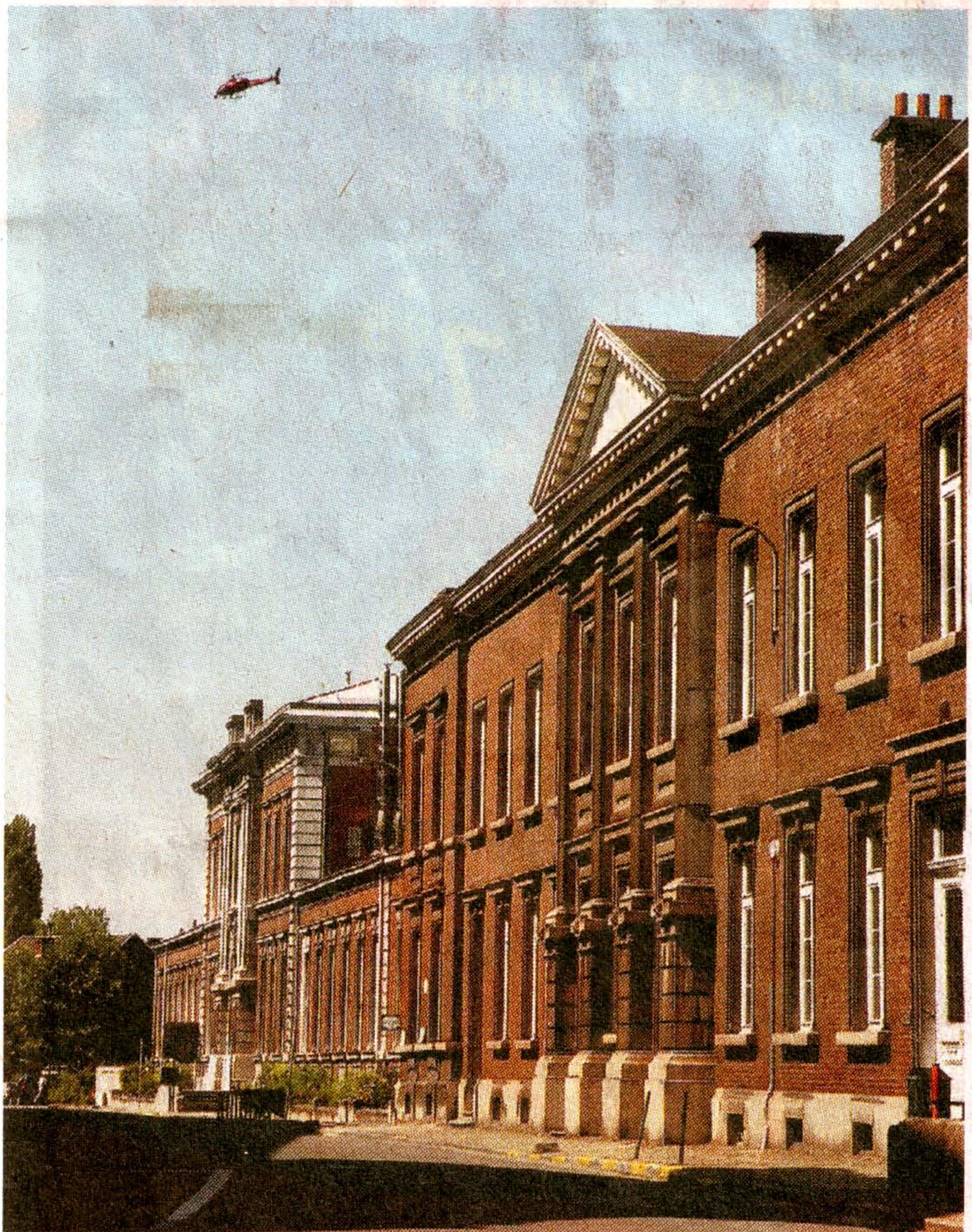
Rue bloquée et renégociations en hélicoptère à l'Athénée

> Samedi 23 août. Arrêt et stationnement interdits de 11h30 à 17h30 et circulation interdite entre 15 heures et 17h30.