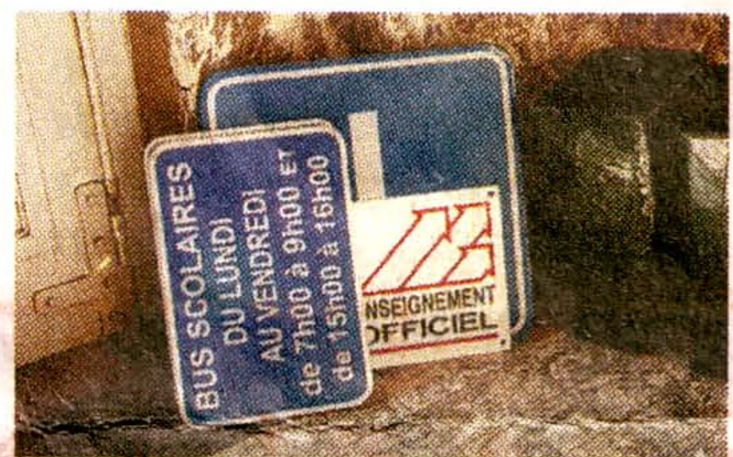
On enlève ce qui est récent